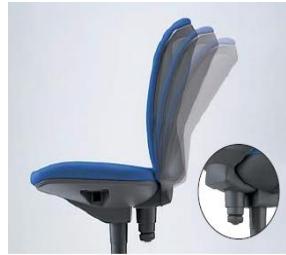
Flexible backrest and tension adjustment The tension can be adjusted to suit user's posture with the control lever under the seat.