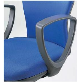
Armrest (Detachable) Armrest can be assembled easily.