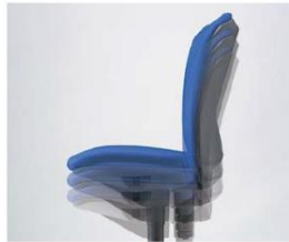
Seat height The seat height can be adjusted with a single touch to suit the desk height and the user's working posture.